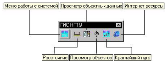
Рис.1. Панель инструментов пользователя прикладной ГИС

VBA проект автоматически загружается вместе с загрузкой Land Development Desktop, активизируется панель инструментов созданная для инженера-пользователя ГИС НГТУ (рис.1).