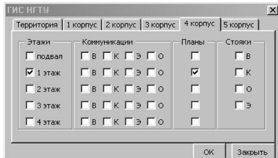
Рис.3.Матричная структура окна управления

Причем строки и столбцы матрицы имеют ясный прикладной смысл. Поэтому предлагаемая структура окон особенно компактна, наглядна и эффективна для управления в прикладной системе. Программная реализация окна достаточно проста и иллюстрируется ниже (табл.2) двумя короткими фрагментами: