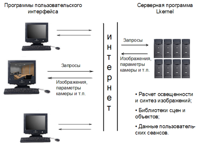
Рис. 1. Организация Интернет-приложения для интерактивного физически аккуратного моделирования освещенности; взаимодействие компонентов пользовательского интерфейса с серверным компонентом

действий редактирования, текущие параметры камеры и т.п. Серверный компонент поддерживает одновременную работу нескольких пользователей и обеспечивает размещение данных, ассоциированных с множеством текущих сеансов.