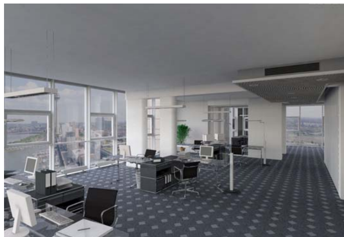
Рис. 2а. Пример фиксированной сцены

представлен на рис. 2а. Параметрическая сцена представляет собой помещение, имеющее форму призмы: пол и потолок имеют форму многоугольника, а стены - прямоугольные, одинаковой высоты. Пример параметрической сцены представлен на рис. 2б. В каждый момент может быть загружена только одна сцена, и при загрузке новой сцены теряется возможность работать с предыдущей. Данные сцены загружаются в вычислительный кластер сайта, предоставляющего Интернет-приложение. На компьютер пользователя пересылаются только ее изображения в соответствии с действиями, которые он производит.