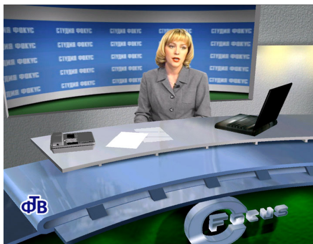
Рис. 3 Пример работы виртуальной студии, полученный с помощью системы "ФОКУС"

Опыт, накопленный в процессе развития тренажерных систем и комплексов, позволил спроектировать виртуальную студию полностью на базе персонального компьютера. В настоящее время, примером успешной реализации этой технологии является семейство виртуальных студий "ФОКУС" [5]. Виртуальная студия на базе персонального компьютера – это программный инструмент телевизионного производства, основывающийся на совмещении виртуальных декораций (изображений, синтезируемых на компьютере) и реального видео, живых актеров и компьютерных персонажей, и т.п.