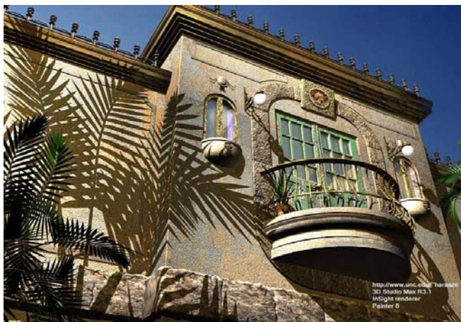
Рис. 1. Реалистичные изображения, полученные нашим модулем моделирования освещенности в среде 3DS Max.

На рис. 1 представлены результаты моделирования освещенности и синтеза реалистичных изображений для моделей, созданных в среде 3DS Max. Высокий реализм достигается благодаря высокой степени детализации геометрической модели, подготовленной дизайнерами в CAD системе, и физически аккуратному моделированию распространения света, поддерживаемому нашим модулем.