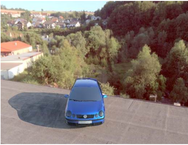
Рис. 2. Изображение, построенное на базе БДДИ «Direct sun roof 003.hdr» (динамический диапазон – 6,4 \cdot 10^5 )

видно из таблицы изображения с большим динамическим диапазоном, созданные фирмой Spheron, содержат величины яркостей с гораздо лучшим диапазоном. Два последних БДДИ имеют приемлемый диапазон яркостей ( 6 \cdot 10^5 ). Диапазон двух предпоследних также близок к приемлемому.