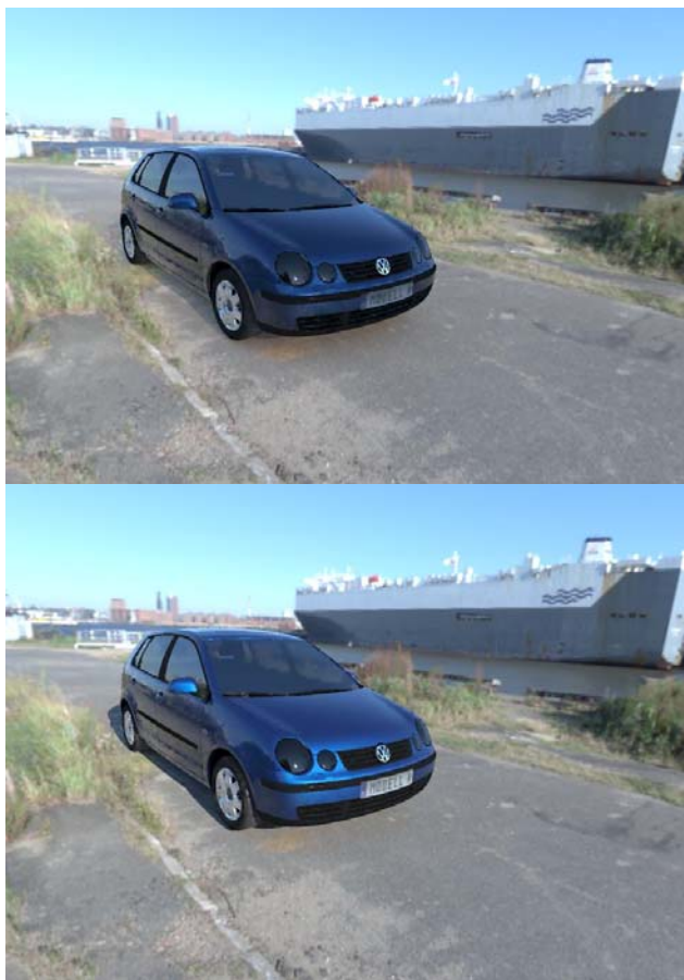
Рис. 3. Применение компенсации некорректности задания солнца. Верхнее изображение было построено без компенсации, нижнее – с компенсацией

После анализа БДДИ стало понятно, что алгоритмы моделирования освещенности и генерации реалистичных изображений должны быть модифицированы таким образом, чтобы скомпенсировать недостатки этих БДДИ. Одной из главных проблем является недооценка яркости солнца , которая всегда будет присутствовать даже в БДДИ с приемлемым динамическим диапазоном.