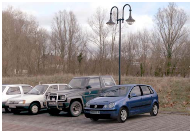
Рис. 4. Использование технологии «двойного кадра» для представления реалистичного фона для изображения компьютерной модели автомобиля

Эта технология требует дополнительного пользовательского интерфейса для задания соответствия направлений БДДИ («первый кадр») и простого фонового изображения («второй кадр»). На рис. 4 показано изображение, сгенерированное с использованием технологии «двойного кадра», дающей хорошую степень реалистичности.