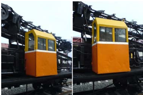
Рисунок 3: Выбранная пара изображений.

Уточненная трехмерная модель кабинки изображена на рис. 5, справа. Вертикальное ребро теперь восстановлено верно.