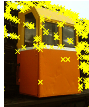
Рисунок 4: Результат поиска уголков детектором Харриса.

В представленной работе предложен подход, позволяющий уточнить результат восстановления трехмерной сцены по небольшому количеству характеристических точек, прослеженных на последовательности цифровых изображений. Подход основан на обнаружении характеристических точек, моделирующих сцену, и уточняет модель, увеличивая их количество. Не считая предположения, что форма сцены не деформируется за время получения ее изображений, подход не требует специфических условий съемки и априорных знаний о сцене.