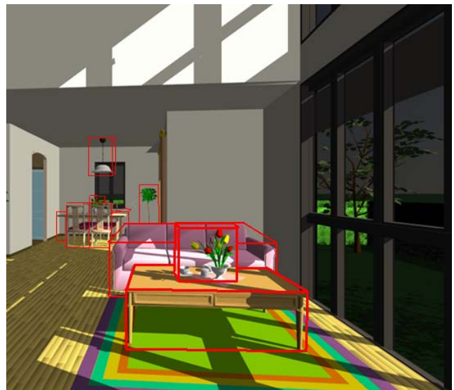
Рис. 2. Организация сцены для двухуровневой трассировки лучей. Красными контурами показаны параллелепипеды, ограничивающие объекты сцены.

Организация сцены для двухуровневой трассировки проиллюстрирована на рис. 2.