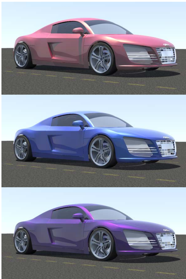
Рис3. Примеры визуализации в Inspire САТІА.

На рис.3. приведены результаты визуализации автомобиля в Inspire САТІА при естественном освещении и использовании различных красок, задаваемых двунаправленной функцией отражения: