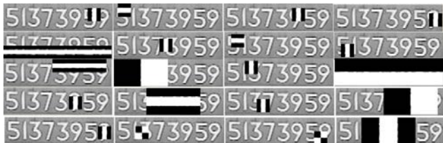
Рис.3. Фильтры признаков номерных знаков, обладающих наилучшими обобщающими свойствами по версии данного алгоритма обучения.

Построенный в результате машинного обучения классификатор использует для принятия решения ограниченное количество признаков и работает в режиме реального времени. На рис.3 показаны фильтры признаков номерных знаков, которые по версии данного алгоритма обучения обладают наилучшими обобщающими свойствами.