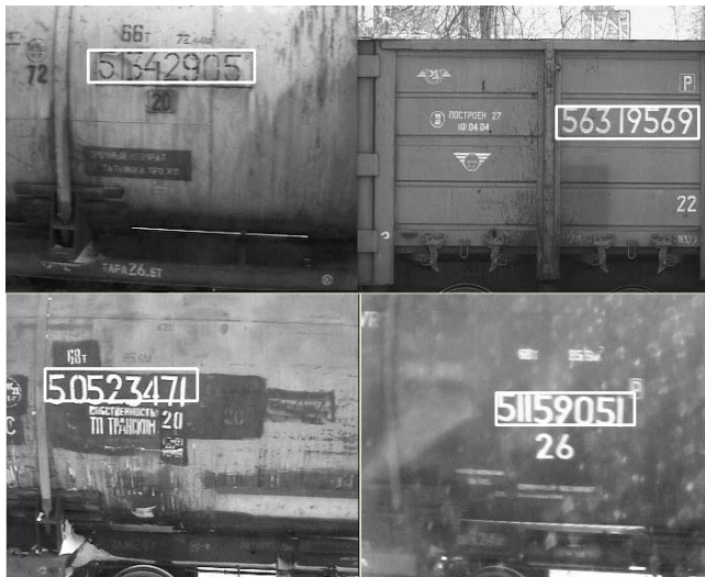
Рис.4. Примеры работы алгоритма обнаружения номерных знаков железнодорожного подвижного состава.

Примеры работы алгоритма обнаружения номерных знаков на основе обученного каскадного классификатора показаны на рис.4.