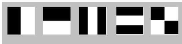
Рис. 2. Фильтры Хаара для выделения характерных признаков номерных знаков.

прямоугольника, который может занимать различные положения и масштабы на изображении.