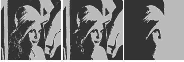
Рис. 1. Кластеризация пикселей и сегментация изображения в инвариантном представлении

пикселей на первом шаге кодирования [11] просто заменены значениями 0 и 2 числовых кодов инвариантного представления яркости и нормализованы на рабочий диапазон.