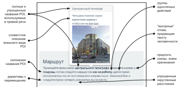
Рис. 4: Составные части текстового описания пути, используемые алгоритмом.

Большую сложность составляет подзадача придания тексту “человечности”. Для ее решения был разработан следующий механизм формирования каркаса лексем, основанный на случайных величинах и частотах использования слов и оборотов. Все описание разбивается на блоки PB = \{ACTION\_TYPE, DIRECTION, RELATIVITY\_NEAR, POI\_NAME\_NEAR, DISTANCE, RELATIVITY\_TILL, POI\_NAME\_TILL\} (важно сразу отметить, что не все поля пятерок PB будут использованы в итоговом сформированном текстовом описании):