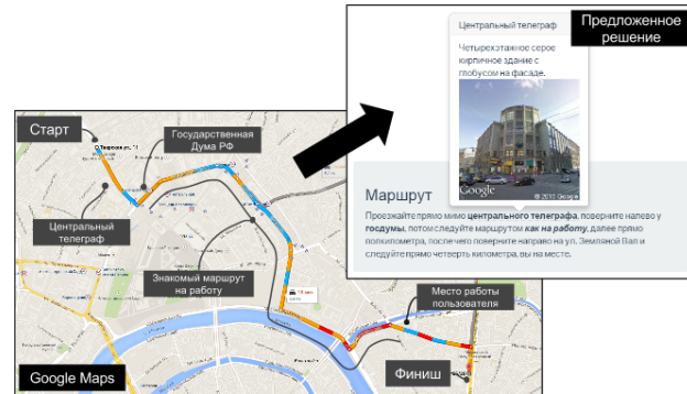
Рис. 5: Пример перевода изображения траектории в текстовое представление с использованием значковых пользователю маршрутов и POI.

вательность действий с несколькими обобщениями, позволяющими сократить объем вводимой пользователем информации.