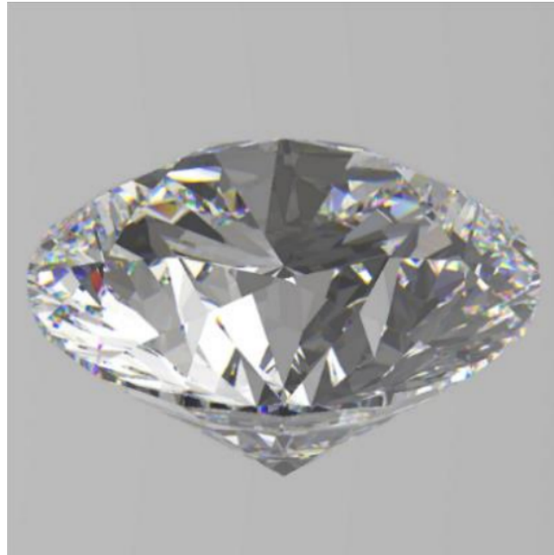
Рис. 3: Визуализация бриллианта в спектральной панораме.

Пример визуализации бриллианта в работе [5] с использованием спектральной панорамы окружения, полученной из RGB панорамы описанным методом, приведен на рис. 3.