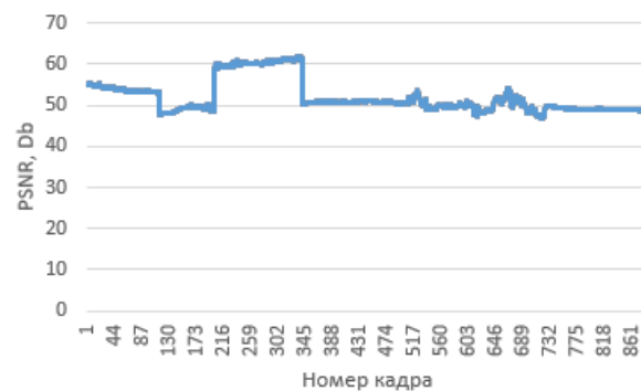
Рис. 2: График пикового соотношения сигнала к шуму для одного видеопотока, упакованного предложенным методом.

Графические артефакты при упаковке. Проведена серия тестов графических искажений при упаковке графических окон. Для этого была использована величина пикового соотношения сигнала к шуму (PSNR) [2]. Пример подобного теста представлен на рис. 2. Можно отметить, что среднее значение величины PSNR находится в районе 50 Db.