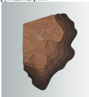
Рис. 1. Визуализация часов

Первый этап – это визуализация объекта. Он заключается в создании 3D модели. Она создавалась в несколько шагов. Первый заключался в отрисовке формы в графическом редакторе, который позволяет создавать векторные изображения. Затем уже подготовленный объект импортировался в программу (импорт производился с помощью формата DWG) и далее уже создавалась сама модель с помощью различных функций. Созданный объект состоял из 7 пластин (Рис. 1) с градацией цвета от более светлого до более темного. Данный переход подчеркивает заданную идею и позволяет разграничить контур. При визуализации накладывался материал имитирующий дерево.